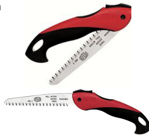
PILA FELCO 600 nož 16 cm